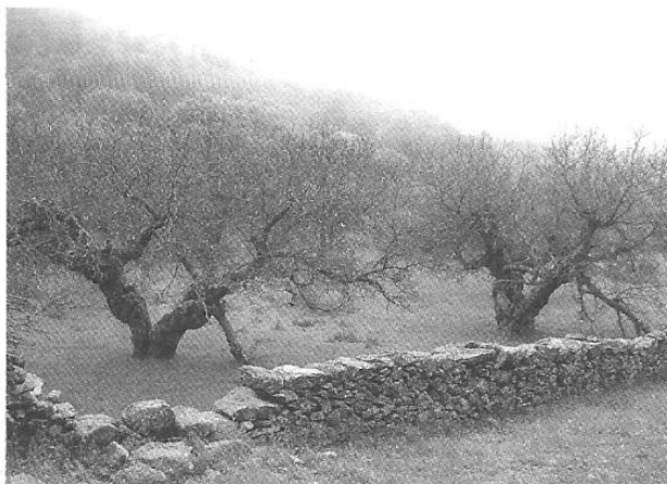
"Paraje del Cerro del Castillo (Bayuela) donde pudo estar la ermita de La Magdalena".

en tierras desta villa, el qual es de dos piernas y está como bamos desde la hermita de la Magdalena a Ntra. Sra. del Castillo, a mano izquierda, entre unos cantos que dan vista a la hermita..." 4 .