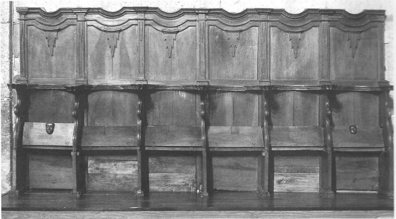
Sillería de coro conservada en la iglesia de Navamorcuende, posiblemente la original bajada del Convento de El Piélagu y bajada en 1817-1819.