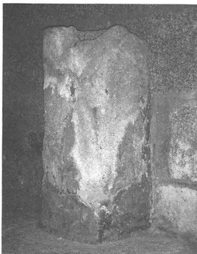
Peana de piedra de la imagen del Santísimo Cristo bajada del Convento de El Piélagu en 1809-1811 (Iglesia de Navamorcuende).

“Silleria del coro. It doscientos rrs satisfechos a la Comunidad del Piélagu por transaz[i]on a virtud de la cual quedo a favor de esta iglesia la silleria del coro, pulpito y cuadro de Ntra. Sra. co-